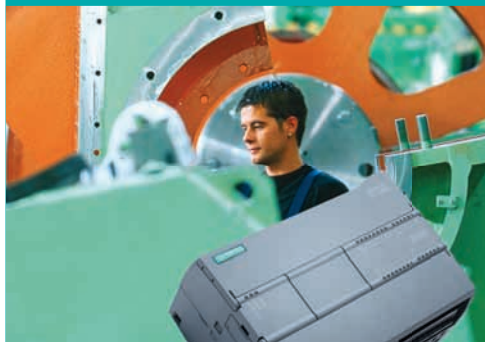
Simatic S7-1200 / CPU 1215C