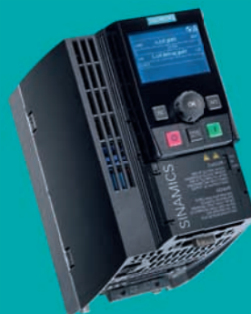
Convertitore di frequenza modulare Sinamics G120