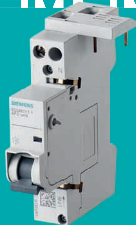
Unità di rilevamento dei guasti con formazione di arco 5SM6