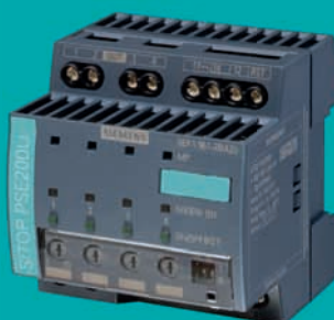
Modulo di selettività Sitop PSE200U